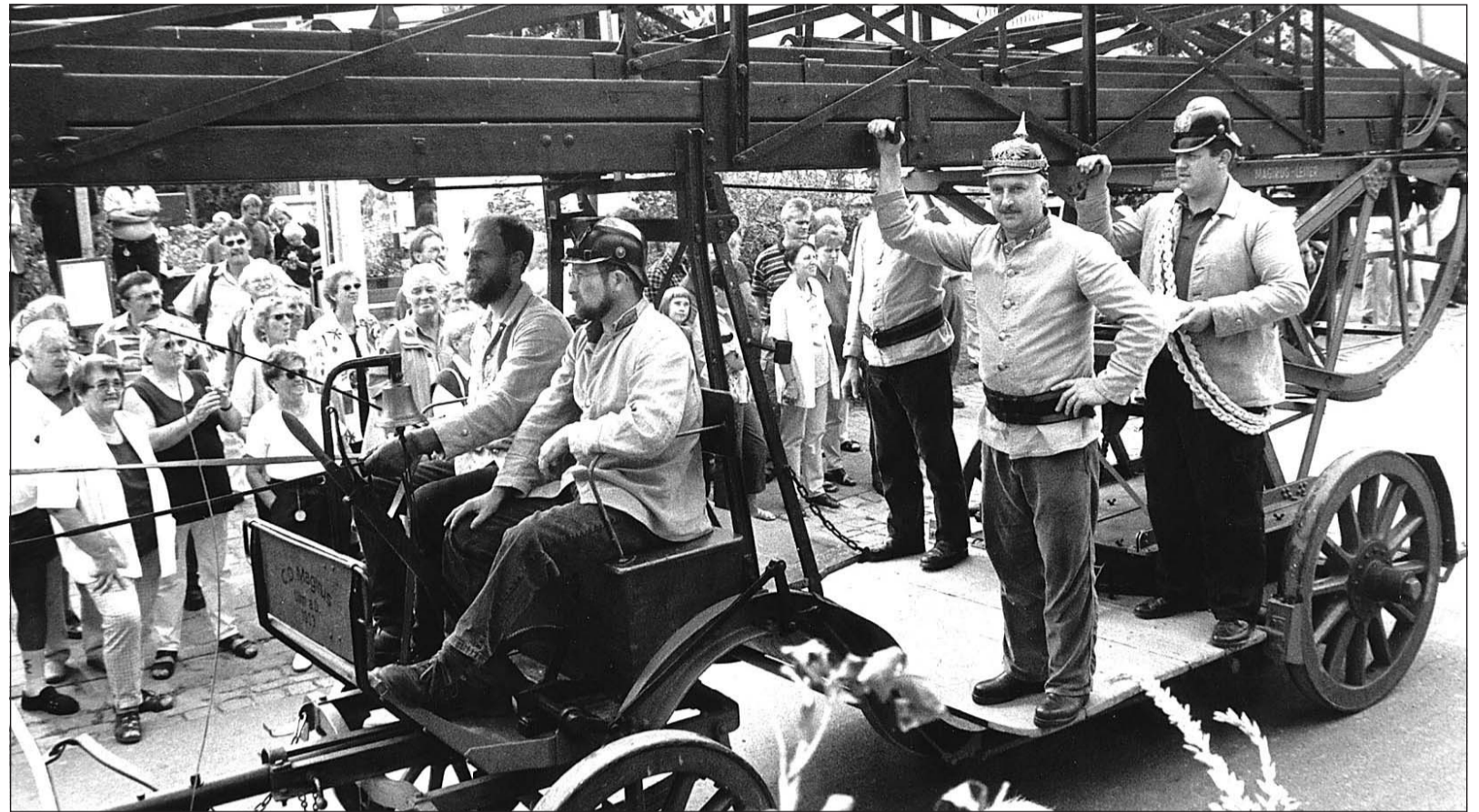
Im Jahr 2000 hat Ottenhausen sein 1150-jähriges Bestehen gefeiert. Das Jubiläum wurde groß begangen unter anderem mit einem historischen Festumzug. Tiefen Einblick in die Geschichte geben jetzt das neue Dorfarchiv und eine ausführliche Dorfchronik, die bald gedruckt wird.

Dazu kommt ein gewaltiges Archiv an Zeitungsartikeln, angefangen 1903 mit der Steinheimer Zeitung, die er sich aus dem