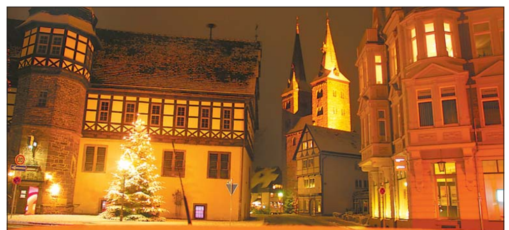
Die Innenstadt von Höxter (hier am Rathaus) wird in diesen Wochen in ein zauberhaftes Licht getaucht. Noch ein paar Tage und dann müssen die Weihnachtsbeleuchtung abgebaut und die Christbäume für das Osterfeuer eingesammelt werden.