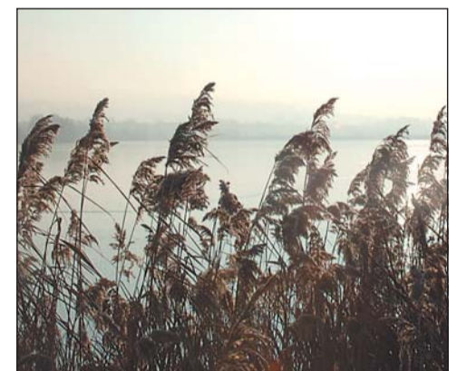
Vorsicht Eis, Lebensgefahr! Die zugefrorenen Godelheimer Seen dürfen nicht betreten werden. Das Eis ist zu dünn.