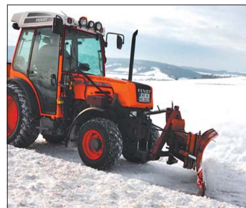
Ein städtischer Mitarbeiter schiebt mit einem Räumfahrzeug den Rad- und Fußgängerweg (Foto) bei Brenkhausen frei.