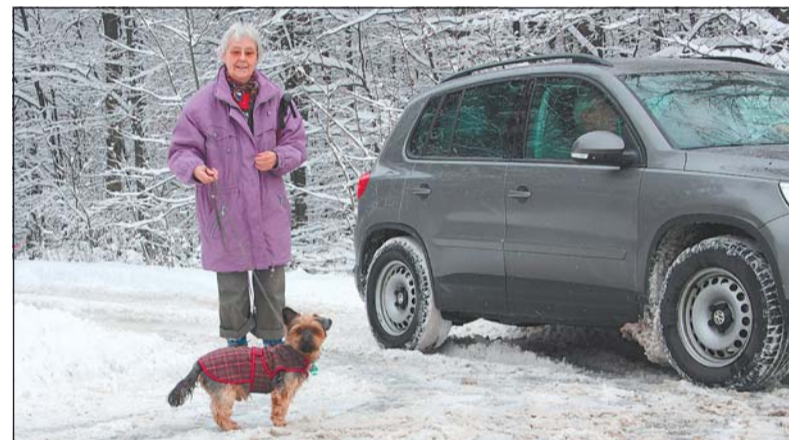
Hund im Winteroutfit beim Spaziergang im Eggegebirge bei Bad Driburg: Dem Vierbeiner wird mit Decke bestimmt nicht kalt.