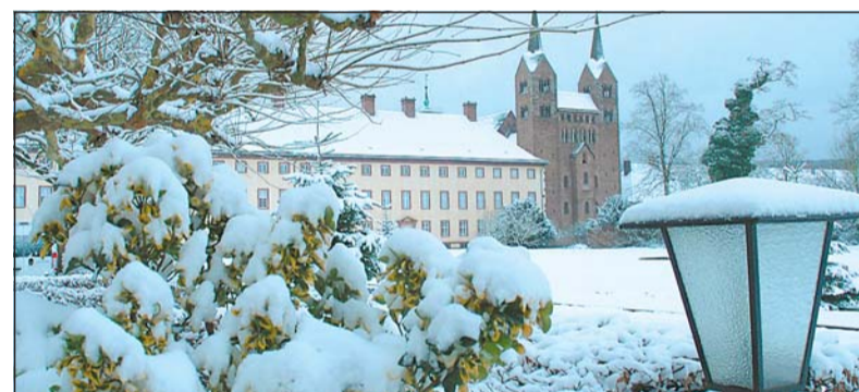
Tief verschneites Schloss Corvey: Ein Spaziergang zur ehemaligen Reichsabtei im Winterkleid drängt sich in diesen Tagen auf. So mancher Fotograf gerät beim Anblick in Verzückung.