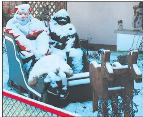
Nikolaus und Knecht Ruprecht auf Rückfahrt in den Himmel: Viele Autofahrer halten an der Kutsche (B 64 in Ottbergen).