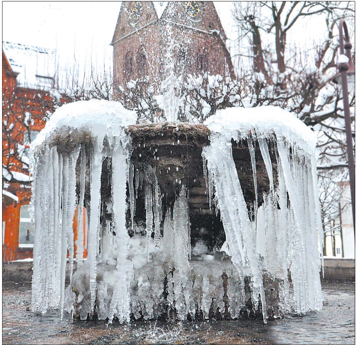
Das Wahrzeichen der Emmerstadt, der Kump, hat sich präsentiert. Das faszinierende Naturschauspiel am Brunnen lädt zum Verweilen ein.