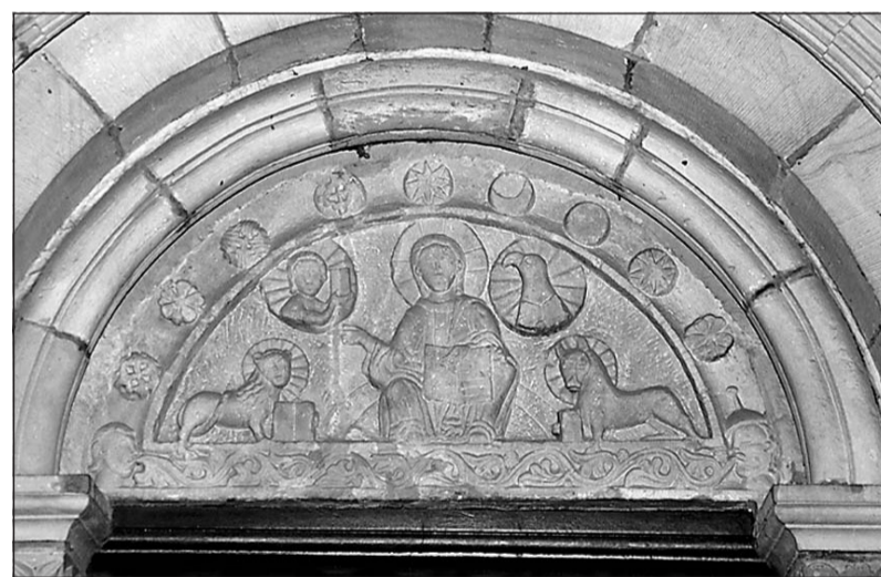
Das Tympanon der Kirche ist ursprünglich aus der Zeit um 1150 und zeigt Christus als Weltenrichter. Es gehört zu den Sehenswürdigkeiten der Stadt.