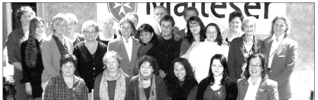
18 Frauen und Männer haben beim Malteser-Hilfsdienst in Steinheim die Ausbildung im Pflegehilfsdienst erfolgreich absolviert. Viele haben bereits eine Anstellung gefunden.

Die Gräfin dankte den Dozenten, die die theoretische Ausbildung von 80 Stunden ehrenamtlich erbracht hatten. Die Mehrzahl der Teilnehmer konnte inzwischen eine sozialversicherungspflichtige Tätigkeit in einer Pflegeeinrichtung finden, andere nutzen die gewonnenen Erkenntnisse zur Pflege von Angehörigen zu Hause.