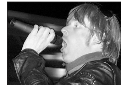
Sänger Mickey Krause kommt am 22. August nach Vinsebeck. Er wird dort gegen 22.30 Uhr erwartet.

terstützt. In sechs Jahrzehnten ist nicht nur eine gute Musiktruppe entstanden. Es hat sich auch eine vorbildliche Gemeinschaft herausgebildet. Zum Geburtstag haben die Vinsebecker Musiker einige Höhepunkte im Programm. Am Samstag, 22. August, spielt die Tanz- und Showband »Frontal« in der Halle Meilenbrock auf. Und Als Stargast lässt es Mickey Krause, der Partylöwe von Mallorca, richtig krachen. Das Programm des Jubelfestes im Detail: Freitag, 21. August: 19.30 Uhr, eine musikalische Zeitreise mit dem Spielmansszug Vinsebeck; Samstag, 22. August: 13.15 Uhr Empfang der Gastvereine, anschließend Festumzug und Sternmarsch zum Schloss; Festakt 15.30 Uhr Gemeinschafts- und Bühnenspiel, ab 20 Uhr Frontal (Partyband) sowie Stargast Mickey Krause; Sonntag, 23. August: 9.30 Uhr Festgottesdienst in der Halle mit dem Gospelchor Regenbogen, ab 10.30 Uhr Brunch mit Livemusik und Kinderbelustigung.