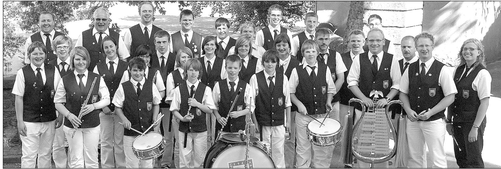
Die Mitglieder des Spielmansszuges Vinsebeck blicken auf ihr 60-jähriges Bestehen. Die Musiker sind zu Botschaftern der Musik weit über die