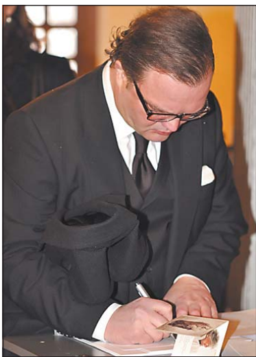
Fürst Alexander zu Schaumburg Lippe trägt sich ins Kondolenzbuch ein.

Mehr Fotos im Internet: www.westfalen-blatt.de