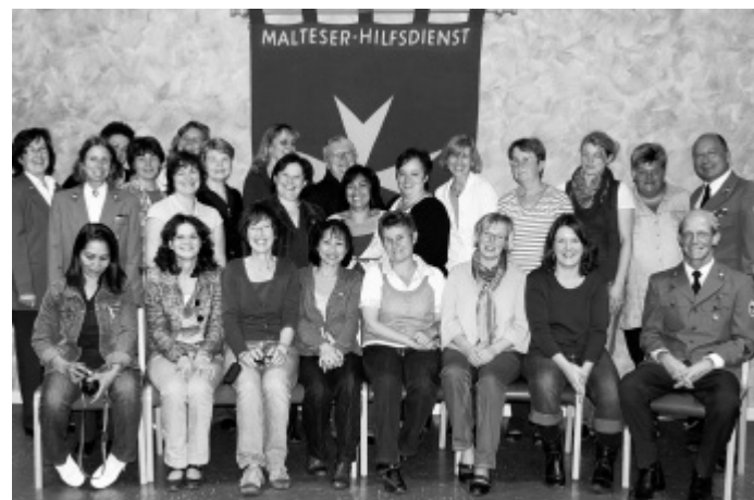
Bestanden: Die Schwesternhelferinnen mit ihren Dozenten.