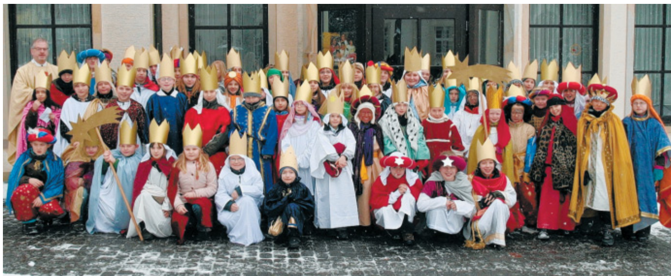
Gutes tun: Sternsinger zu sein macht den Kindern Spaß und gleichzeitig sammeln sie für einen guten Zweck. Steinheim ist groß. Um alle Bezirke abzudecken, werden zahlreiche Mädchen und Jungen gesucht, die an der Aktion teilnehmen.