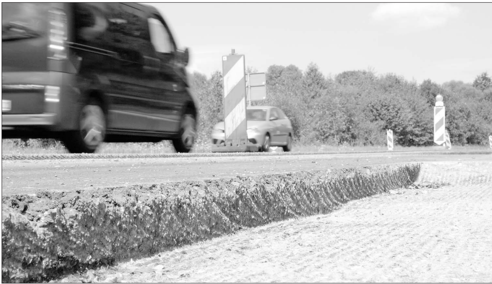
Eigentlich hätte die Ostwestfalenstraße zwischen Nieheim und Brakel längst fertig sein können. Jetzt muss der Asphalt aber erneut abgefräst werden, weil nach Angaben des Landesbetriebs Straßen NRW minderwertiger Bitumen verwendet worden ist.