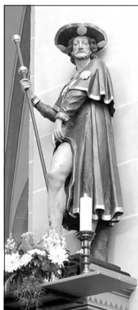
Kerzenlicht in der Marienkirche zur Erinnerung an den heiligen Rochus, der hier als Statue auf seine Pestflecken zeigt.

Polizeiwache: 9 bis 11 Uhr Sprechzeiten in der Dienststelle.