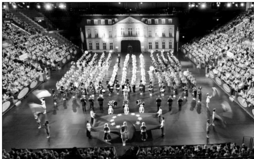
Bekannt aus dem TV: Die Musikparade mit neuem Programm 2010

Die „Internationale Musikparade“ bietet die Stars der Marschmusik und zieht das Publikum mit Pauken und Trompeten in ihren Bann. Abgerundet wird das jährlich neu gestaltete Programm durch Showeinlagen von Chören bis zu exotischer Volksmusik. Doch nicht nur für die Ohren bietet die „Musikparade“ beste Unterhaltung, die Show ist auch ein Augenschmaus: Mit ihren prächtigen Uniformen und beeindruckenden Choreographien dürften die meisten Orchester den Liebhabern der Militär- und Blasmusik aus diversen Fernsehauftritten bekannt sein. Mit dabei sind Militär-Orchester aus Schottland und