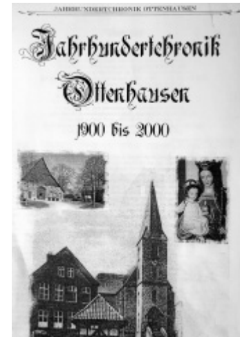
Gebündeltes Jahrhundert: Die Chronik von Franz-Josef Wiechers gilt im Heimatort selbst bereits als Jahrhundertwerk.

■ 1900 = 468 Einwohner, 88 Schulkinder, 25 Geburten, 9 Verstorbene; 1940 = 480 Einwohner, 76 Schulkinder, 13 Geburten, 5 Verstorbene; 1951 = 661 Einwohner, 94 Schulkinder, 9 Geburten, 5 Verstorbene; 1960 = 597 Einwohner, 69 Schulkinder, 22 Geburten, 7 Verstorbene; 1964 = 558 Einwohner, 73 Schulkinder, 13 Geburten, 5 Verstorbene; 2000 = 590 Einwohner, keine Angaben, 6 Geburten, 4 Verstorbene. (kö)