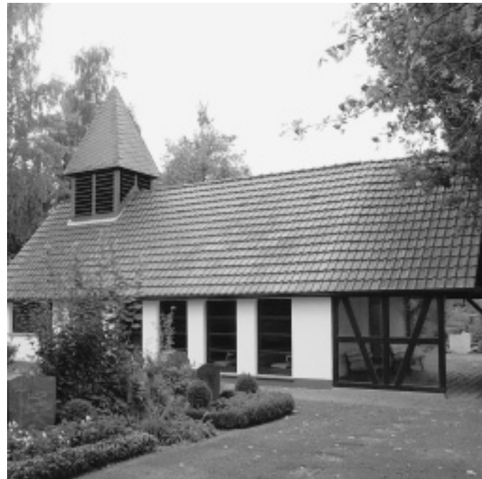
Ort der Besinnung: Ungestört können Friedhofsbesucher an der Kapelle verweilen und sich in Ruhe besinnen.