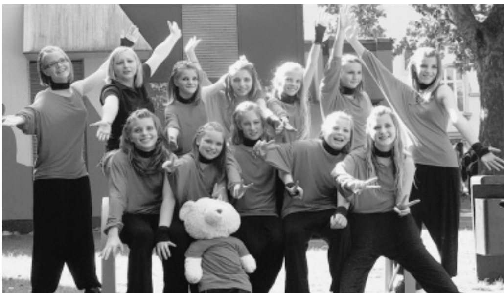
Da freuen sich die jungen Damen: Mit der Qualifikation zur Deutschen Meisterschaft hat sich die Tanzschule Krugmann beim Videoclip-Tanz einen Namen gemacht.

Die Auftritte der Formationen sind auch per Internet als Video zu sehen: www.tanzschulekrugmannnn.de .