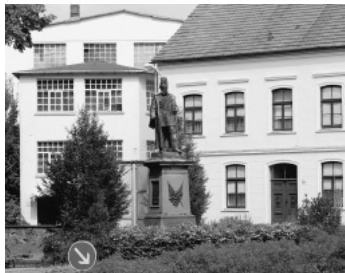
Stadtbildpflege: Die Stadtbild prägende Fassade und damit der Industriecharakter der ehemaligen Möbelfabrik Strato hinter dem Kaiser-Wilhelm-Denkmal (l.) sollen erhalten bleiben.

Wie groß die mit dem GZ verbundenen Hoffnungen sind,