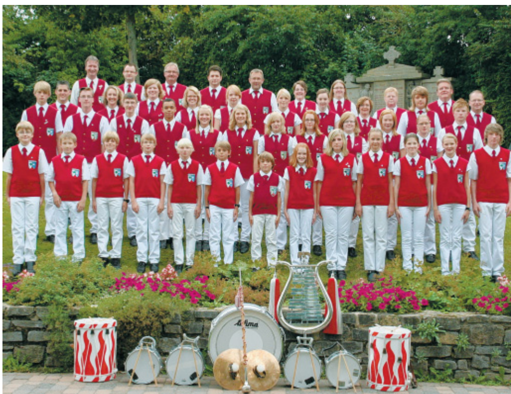
85 Jahre alt, aber keinesfalls in die Jahre gekommen: Der Spielmanns- und Fanfarenzug Ottenhausen feiert am Samstag, 11. September im Festzelt und lädt alle Interessierten herzlich ein.

sein. Und danach wird richtig gefeiert. „Wir haben ab 21 Uhr DJ Mattes engagiert und freuen uns über viele Gäste und eine tolle Party. Der Eintritt ist frei!“