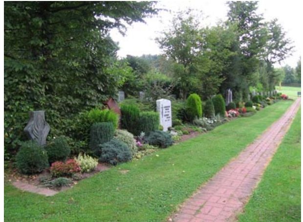
Wahlgrabstätten auf dem Friedhof Steinheim