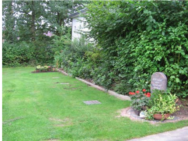
Rasengräber mit Gedenkplatten