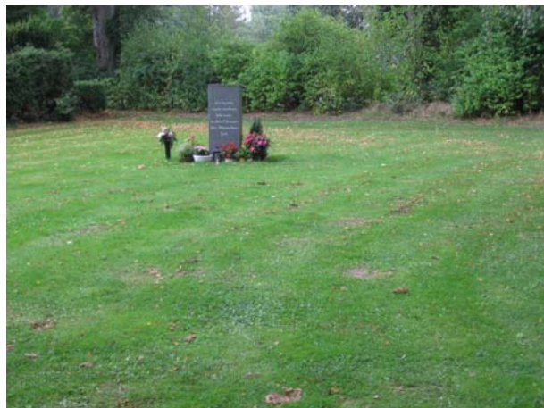
Anonymes Grabfeld mit zentralem Gedenkstein

Auf dem Friedhof sind nicht näher gekennzeichnete Urnenreihen- und Reihengrabfelder für namenlose Bestattungen eingerichtet. Es handelt sich dem Wesen nach um Reihengrabstätten für die Aufnahme des Sarges oder der Asche jeweils eines einzelnen Verstorbenen. Sie werden zeitlich und räumlich "der Reihe nach" für die Dauer der Ruhezeit (30 Jahre) zur Verfügung gestellt. Das Nutzungsrecht kann erst anlässlich des Todesfalles erworben werden. Das Nutzungsrecht am Urnenreihengrab erlischt nach Ablauf der Ruhezeit. Ein Wiedererwerb des Nutzungsrechtes ist nicht möglich. Die Anlage und Pflege der Grabstätten erfolgt durch die Friedhofsverwaltung. Die Grabstätten werden einheitlich mit Rasen begrünt und gemäht. Über die Grablage wird keine Auskunft erteilt.