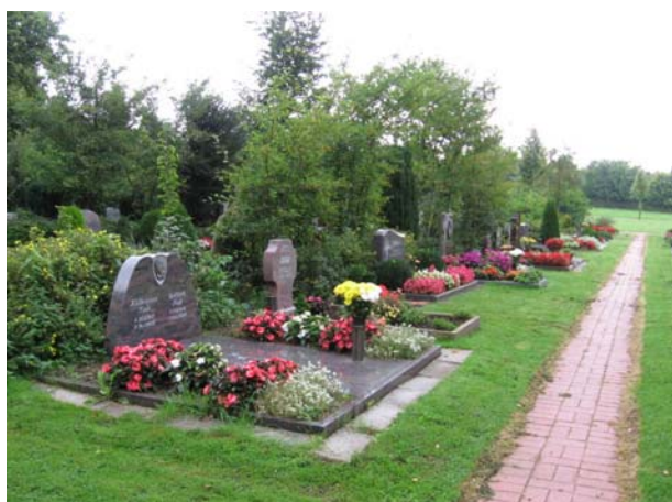
Grabstellen mit allgemeinen Gestaltungsvorschriften