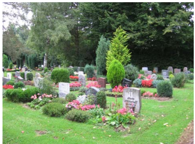
Reihengrabstätten auf dem Friedhof Steinheim