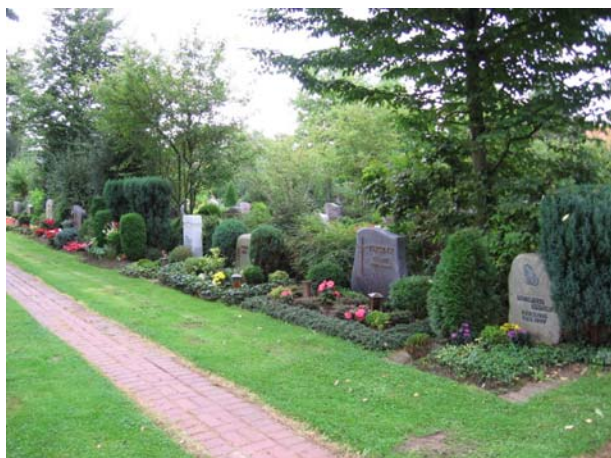
Grabstellen mit zusätzlichen Gestaltungsvorschriften

In Grabfeldern mit zusätzlichen Gestaltungsvorschriften gibt es weitergehende Einschränkungen in Bezug auf die Grabgestaltung und die Größe und Beschaffenheit des Grabmales. Grabeinfassungen und -abdeckungen sind grundsätzlich nicht erlaubt. Sofern Sie dieses – vielleicht auch zu späterer Zeit – wünschen, wählen Sie ein Grabfeld mit allgemeinen Gestaltungsvorschriften.